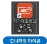
관리자 모니터링 화면